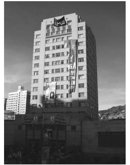
Las autoridades y la burocracia docente-estudiantil han manipulado a su antojo los procesos electorales.

4º aniversario de la Casa Obrera y Juvenil de El Alto.