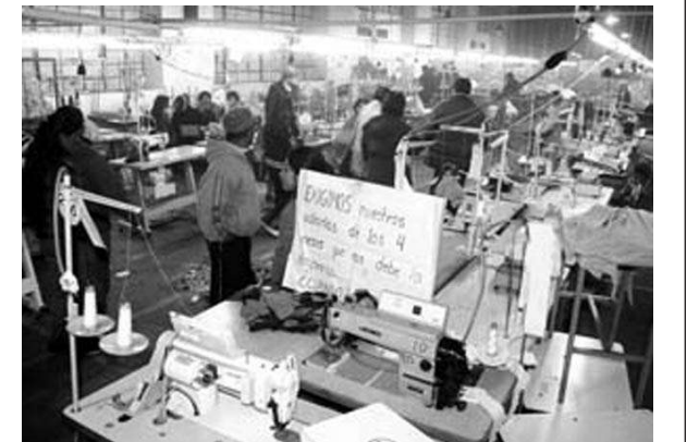
Los trabajadores de MAKITESA en la “vigilia” dentro de la planta.

Hace años que no se producía una ocupación de fábrica en La Paz y la acción de los trabajadores de MAKITESA muestra que éste es el camino para enfrentar las maniobras empresariales, los despidos y cierres, lo que plantea la necesidad de imponer la nacionalización de la empresa, sin pago y bajo control de los trabajadores, única forma de asegurar el mantenimiento de la fuente de trabajo. Desde Palabra Obrera llamamos a brindar la más activa solidaridad con los trabajadores en lucha de Makiteta.