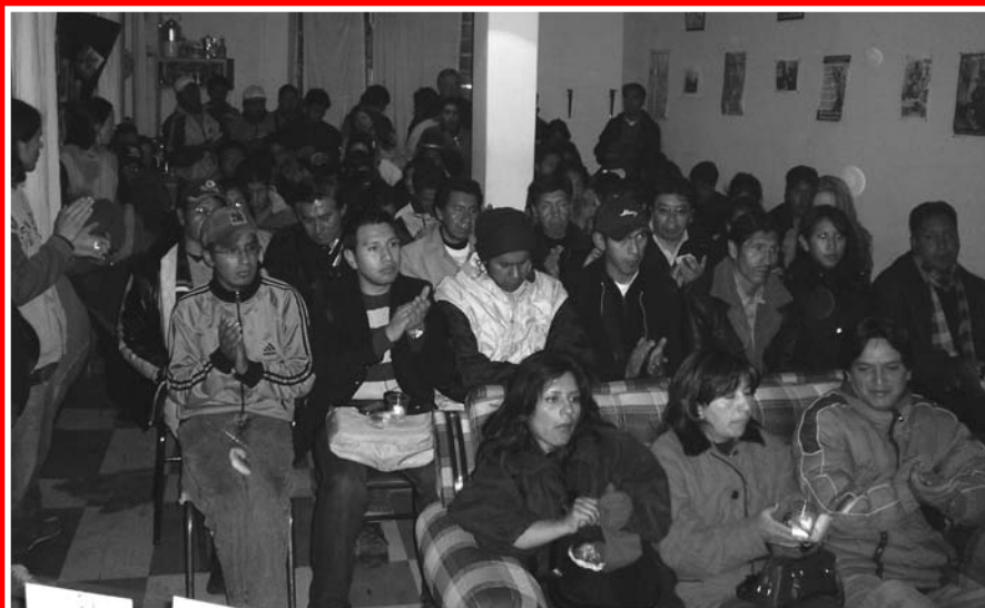
Arriba, imagen del Acto en homenaje al 90º aniversario de la Revolución Rusa, en noviembre de 2007.

A la derecha, Festival por la Nacionalización de los Hidrocarburos, julio de 2005, cuando nació la Casa, que desde entonces sirvió a la lucha y organización de varios sindicatos y sectores de trabajadores y jóvenes alteños.