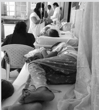
Hacinamiento de enfermos en un hospital

El principal “vehículo” no es el mosquito, es la pobreza y la desatención sanitaria del pueblo