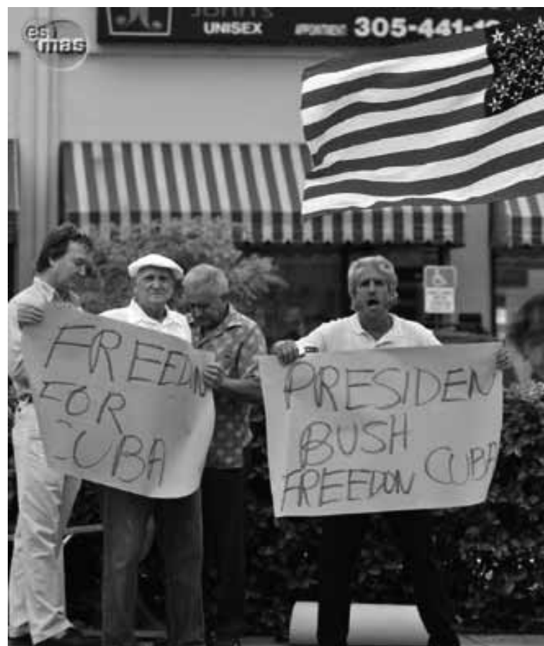
Los gusanos de Miami exigiendo apertura capitalista en la isla

Es decir, que frente a los innegables avances de una economía basada en el mercado, es obligación de revolucionarios marxistas detectar cuando se ha producido el cambio cualitativo que justifique un cambio de caracterización de la importancia que estamos discutiendo. La economía planificada se encuentra herida, seguro, pero aun existe, el monopolio estatal del comercio exterior se encuentra profundamente degradado, pero aun existe, la propiedad estatal ha sufrido profundas alteraciones, seguro, pero aun es la columna vertebral de la economía. Por lo menos habría que reflexionar más seriamente en qué tipo de capitalismo es aquel en que existe trabas a la reproducción del capital como por ejemplo la inexistencia del derecho a herencia, la imposibilidad de vender y comprar libremente no solo