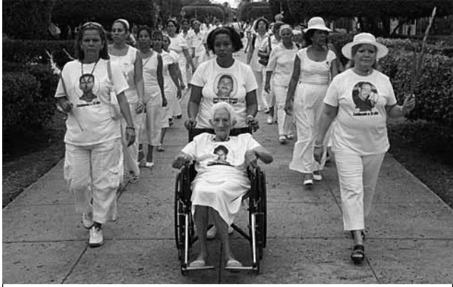
Movilización de las mujeres de blanco

La muerte el pasado 23 de febrero del huelguista de hambre Orlando Zapata, y el inicio por parte del disidente Guillermo Fariñas de su 23ª huelga de hambre, están provocando que Cuba se convierta en un foco de atención de la política internacional.