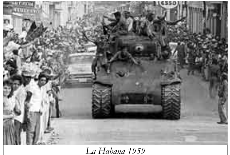
La Habana 1959

Al inicio de la revolución en los primeros 60’, el equipo dirigente de la revolución influenciados por la lucha revolucionaria que llevaban adelante diversos pueblos del mundo como Viet Nam, la lucha de liberación nacional en varios estados africanos y asiáticos, así como un imponente ascenso obrero que