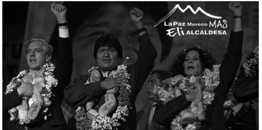
La imagen de Evo Morales apareció muy "pegada" a los candidatos perdedores

En las ciudades claves donde el MAS no gana, influyó el giro que emprendió luego del triunfo de diciembre y que se tradujo en una arremetida judicial-policial contra la derecha "dura", varios de cuyos representantes huyeron