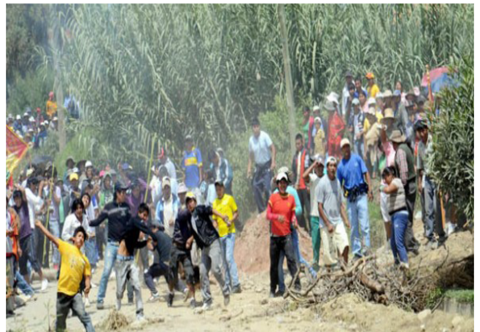
Enfrentamiento Pobladores de Tiquipaya y Colcapirhua.

Es importante definir desde los organismos de representación de los trabajadores un plan de industrialización de los recursos naturales, bajo control de los trabajadores y sectores populares, para así sentar las bases de una economía planificada y productiva en beneficio de las grandes mayorías empobrecidas. La nacionalización de los recursos naturales, la apropiación de los excedentes de manera colectiva y una redistribución de los mismos sobre la base de un plan nacional de obras públicas, discutido desde las bases, debe ser una de las tareas inmediatas en el ideario del movimiento obrero y popular. Las aspiraciones de trabajo, progreso y desarrollo que están impulsando a la movilización de importantes sectores populares de los departamentos debe ser conducido contra el imperialismo, las trasnacionales que operan en las regiones en litigio y el gobierno actual.