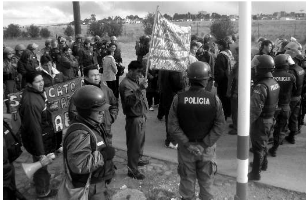
Arriba- bloqueo en las puertas del Aeropuerto