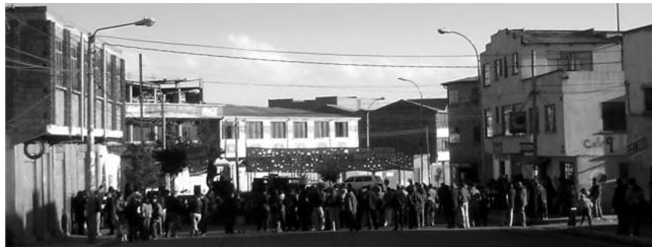
Acto Festival por la “Nacionalización de los hidrocarburos, (2005)