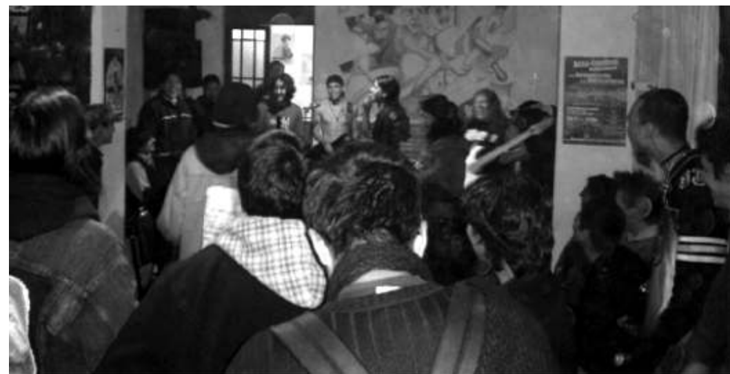
Festival Anti Fascista (2008)

"Contra los empresarios, los latifundistas y transnacionales" era la consigna que dio inicio al festival antifascista reuniendo a muchos jóvenes contra la derecha fascista