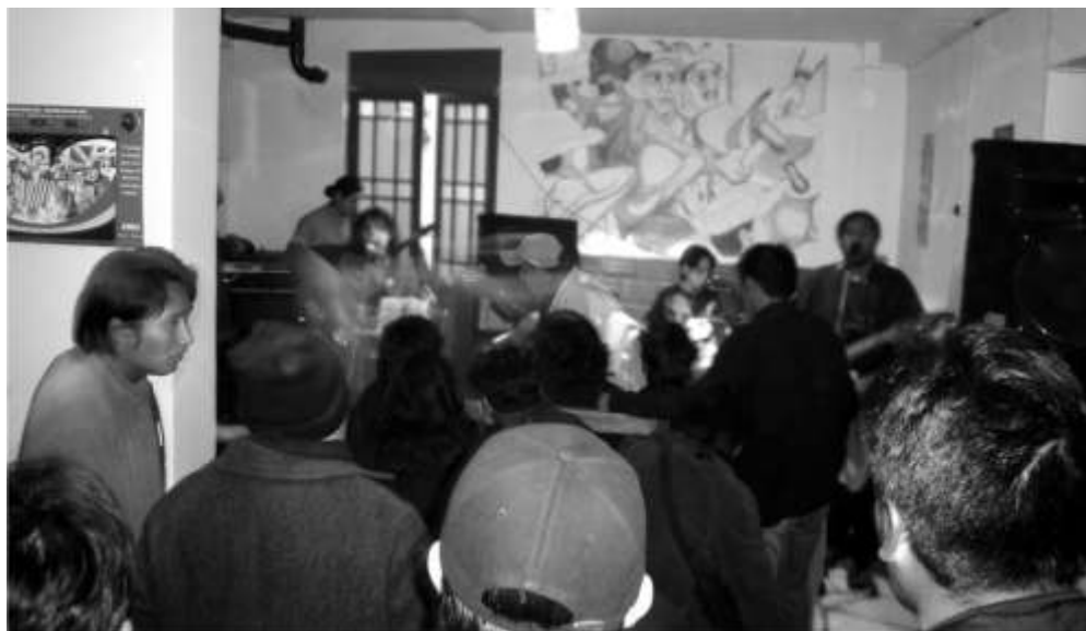
Abajo- Rock en la presentación (2005).

El sábado 16 de Abril de 2005 realizábamos la presentación de la Casa Obrera y Juvenil contando con la participación de trabajadores de distintos sectores de El Alto y una nutrida presencia juvenil, en especial, los jóvenes MC. del naciente movimiento hip-hop. Wayna Rap junto a otras bandas le pusieron música a la presentación.