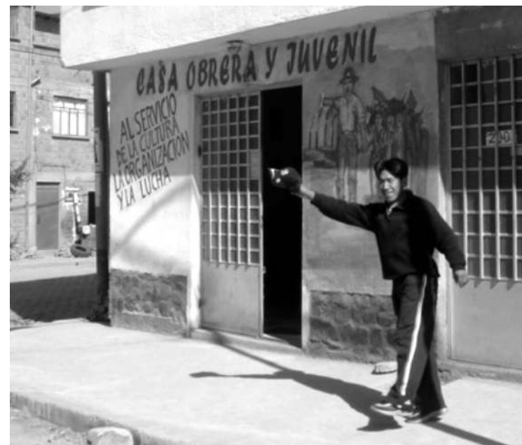
Trabajador del TEA en la Casa. (2006)

Como la mayoría de los 100 mil asalariados de la ciudad de El Alto , las trabajadoras del TEA no tenían derecho a la organización sindical, y hasta se veían obligadas por los empresarios a marchar a favor del TLC, como si se tratara de ganado y no de personas que desean un país distinto. La conformación del sindicato SITRATEA y su posterior lucha contra los despidos es parte de esa nueva clase obrera, precarizada, super explotada, sin organización ni experiencia todavía, pero con sus fuerzas frescas y un enorme potencial.