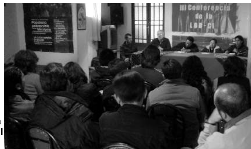
Derecha- Conferencia de la LOR-CI (2008)