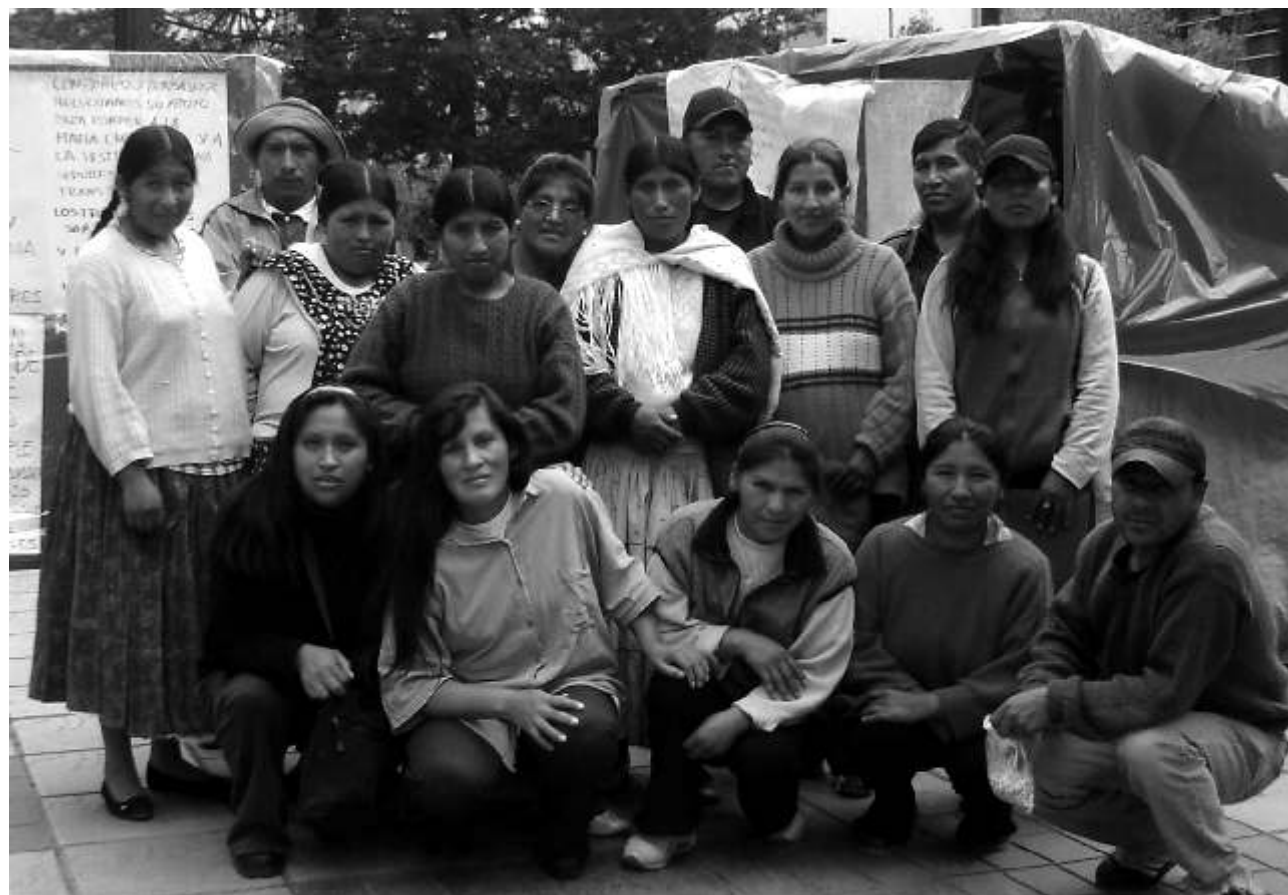
Arriba- Ex Trabajadores de Christies Jewellers en la carpa de lucha en el Prado (2007)

Los 180 trabajadores de la empresa Christies Jewellers (dedicada a la fabricación de joyería de exportación) fueron salvajemente despedidos en el mes de octubre del 2001, luego de varios años de trabajo inhumano.