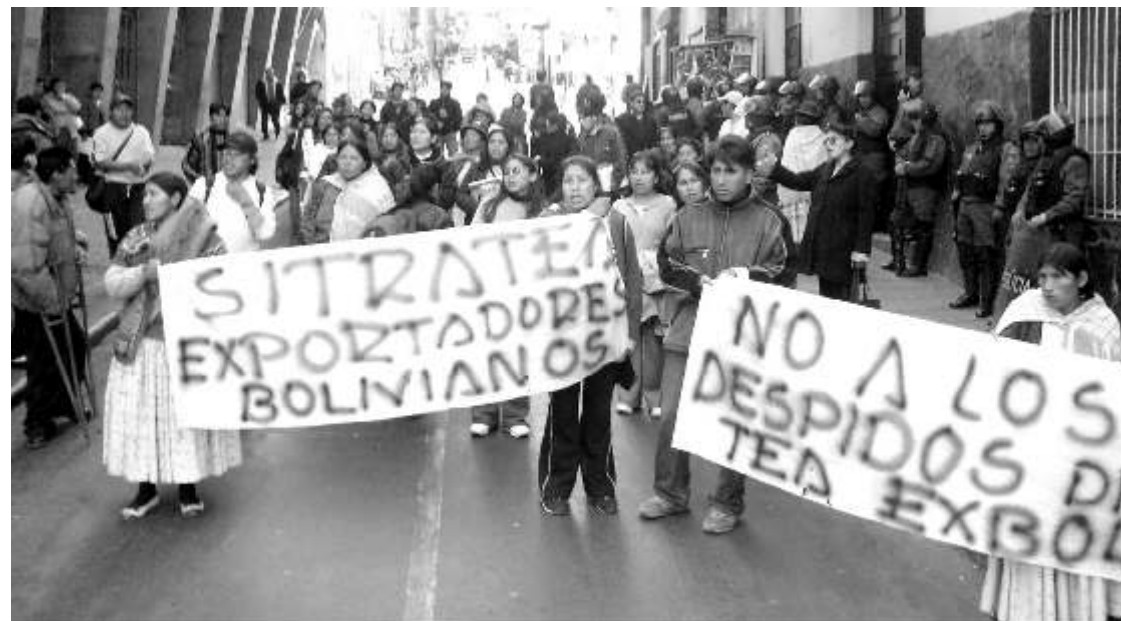
Derecha- Trabajadores del TEA, movilizados en el Ministerio de Trabajo (2006)