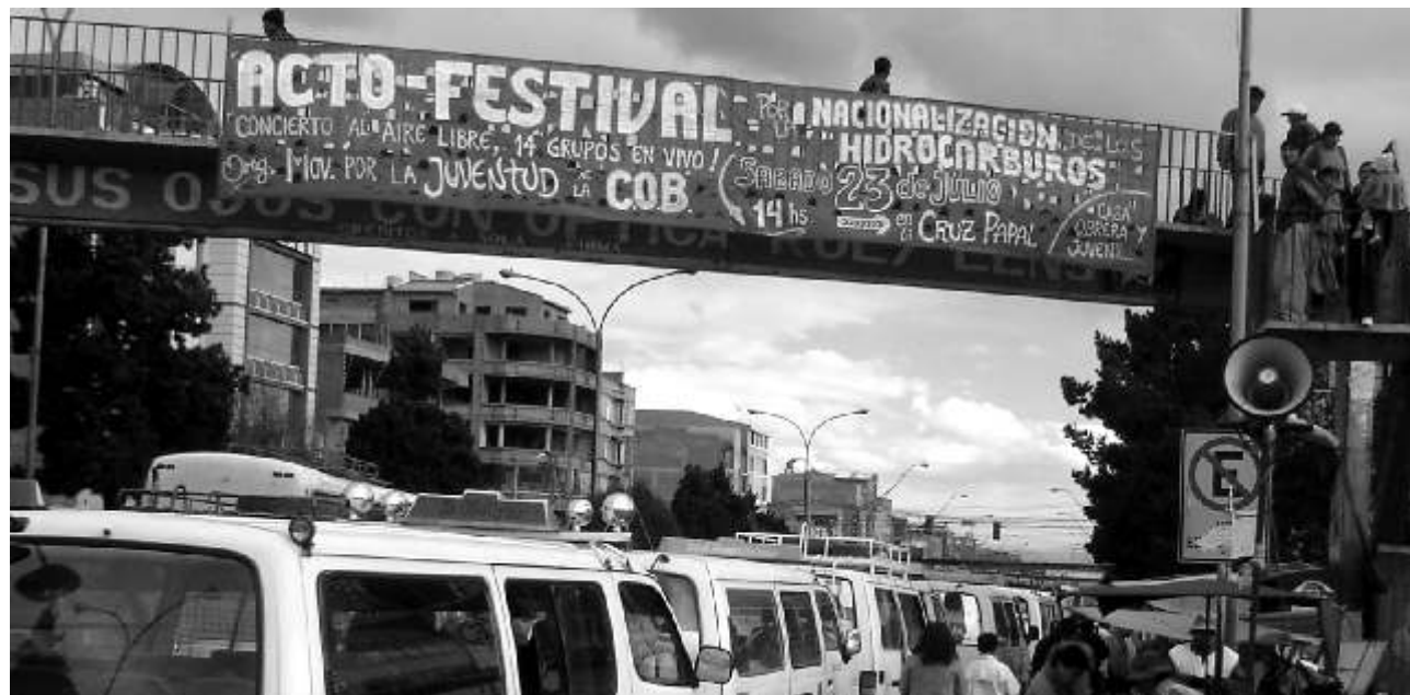
Agitacion en la Ceja por el Acto Festival por la “Nacionalización de los hidrocarburos, (2005)