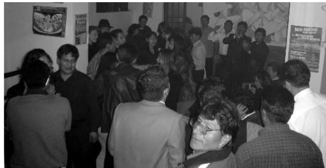
Abajo- fiesta de los trabajadores del Aeropuerto en la Casa Obrera