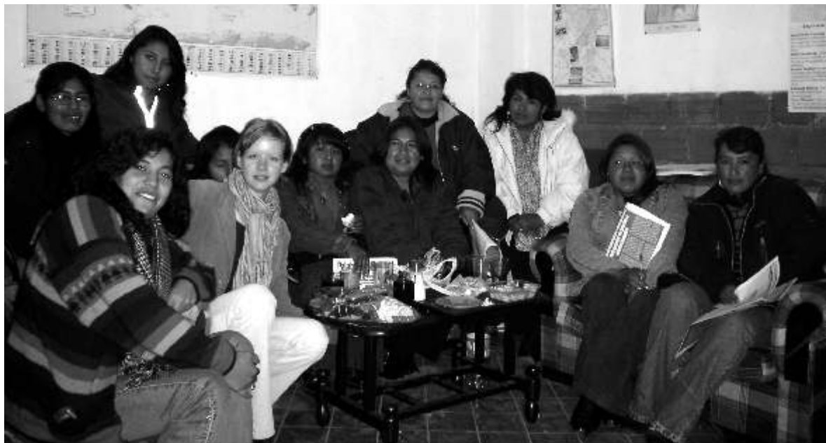
Arriba - Reunión de mujeres trabajadoras en la casa obrera, para abordar la cuestión de la liberación femenina (2008)