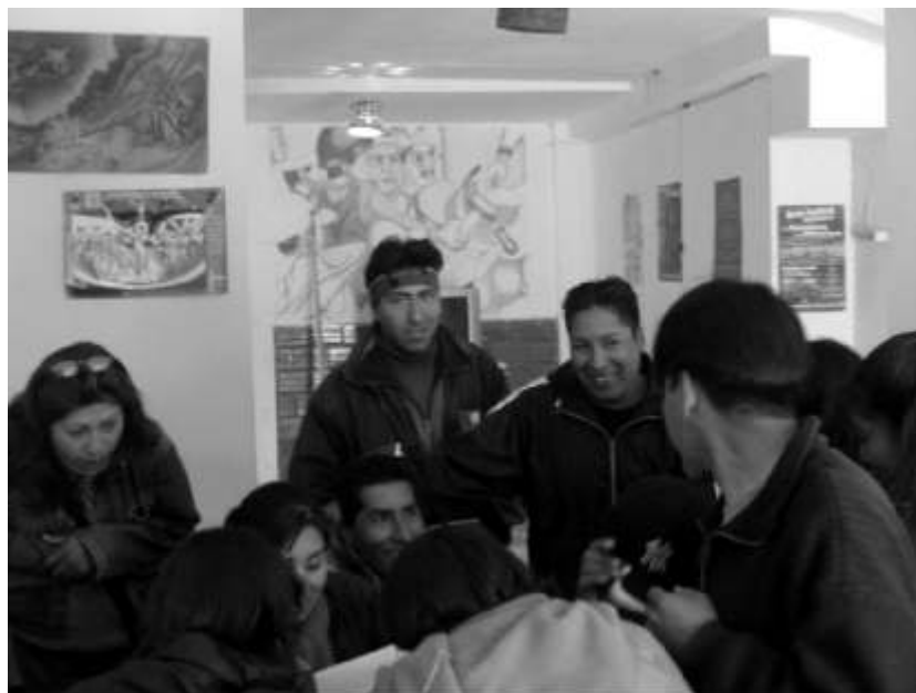
Izquierda- Trabajadores del TEA, planificando una movilización a la CAMEX (2006)