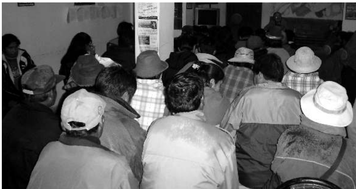
Izquierda- Seminario debate a 40 anos de el asesinato del "Che" Guevara. (2007)

El movimiento juvenil antifascista de La Paz y El Alto estaba integrado por organizaciones juveniles y organizo manifestaciones contra el burgués Doria Medina dueño de Burger King y una marcha reprimida por la policía.