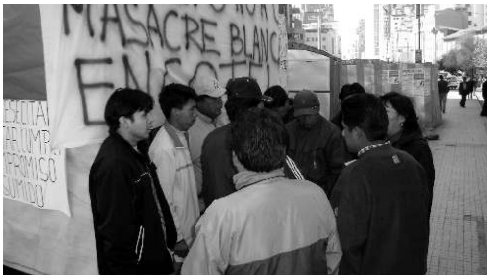
Arriba - Trabajadores de super canal debaten en la carpa