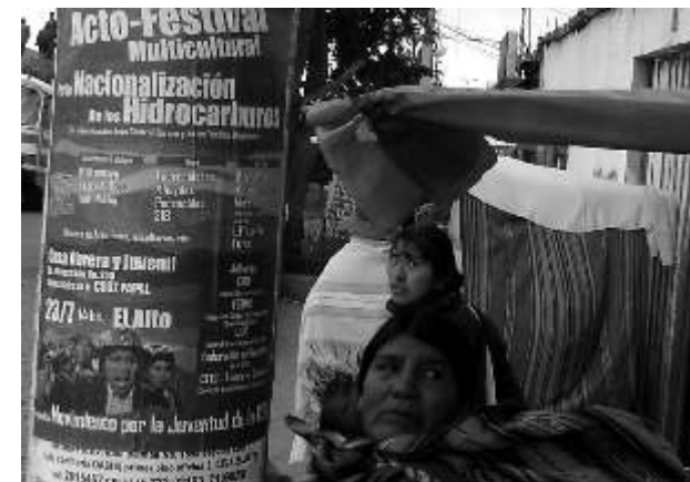
Arriba - Cartel a colores para el festival