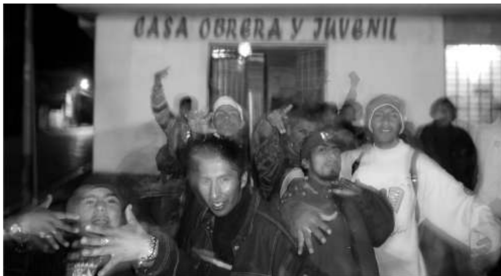
Arriba- El movimiento Hip - Hop en la Casa Obrera (2005)

El sábado 16 de Abril de 2005 realizábamos la presentación de la Casa Obrera y Juvenil contando con la participación de trabajadores de distintos sectores de El Alto y una nutrida presencia juvenil, en especial, los jóvenes MC. del naciente movimiento hip-hop. Wayna Rap junto a otras bandas le pusieron música a la presentación.