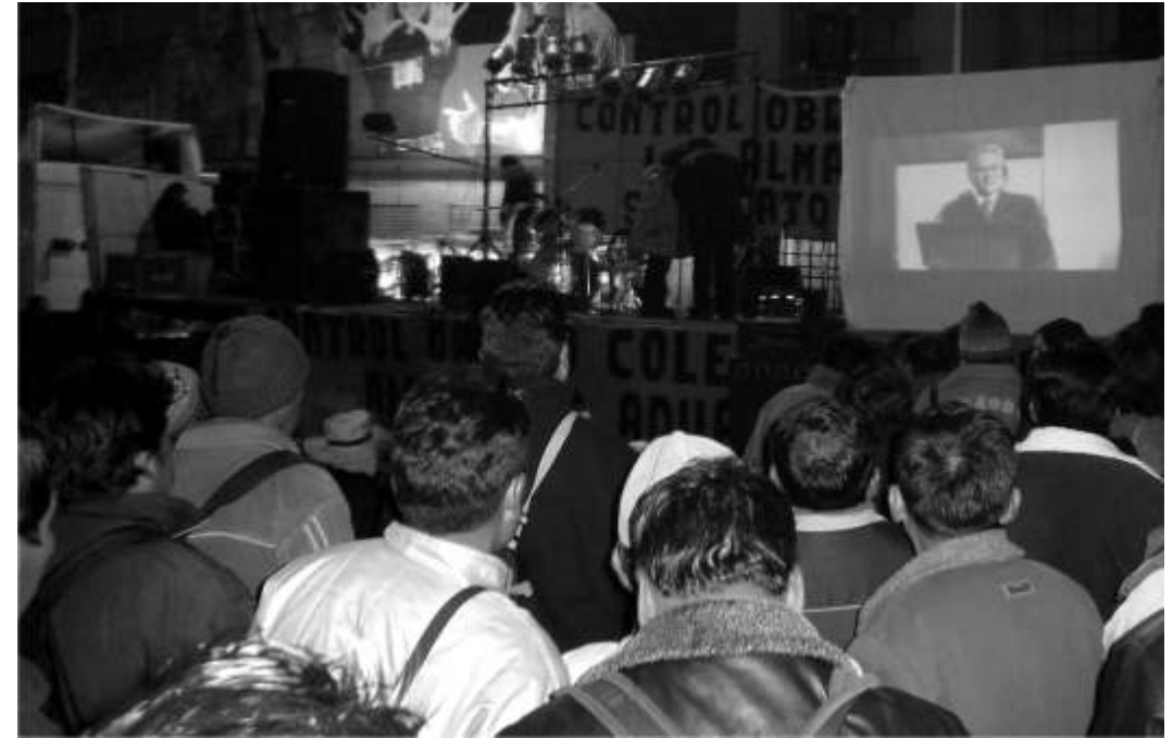
Arriba y Abajo - Festival organizado por el sindicato de DBU y la Casa Obrera (agosto 2007)